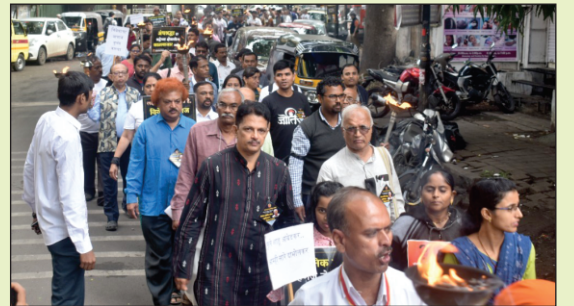
निर्भय मॉर्निंग वॉक