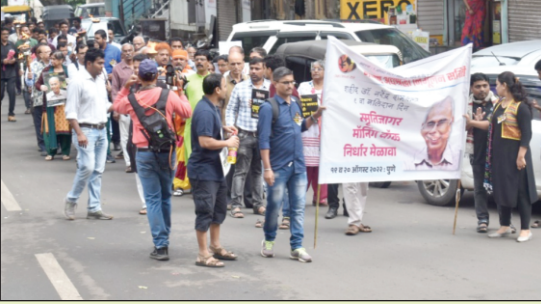
महर्षी विठ्ठल रामजी शिंदे पुलापासून एस. एम. जोशी सभागृहापर्यंत निर्भय मॉर्निंग वॉक करताना.