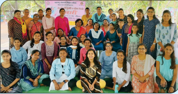
वर्धा येथे भरारी आत्मसन्मानासाठी शिबीर संपन्न