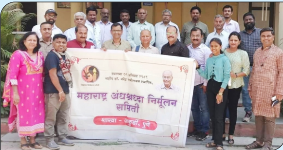
पिंपरी चिंचवड येथे पुणे जिल्हा बैठक संपन्न