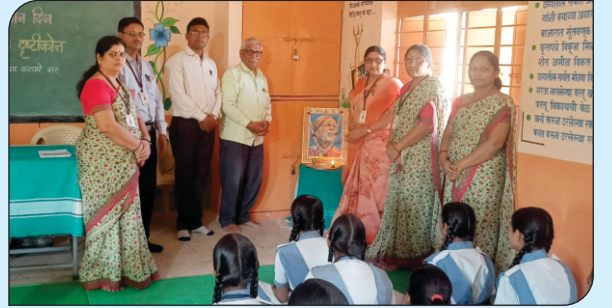
संत गाडगेबाबा जयंती आणि राष्ट्रीय विज्ञान दिन मानव सेवा विद्यालय, जळगांव येथे साजरा करण्यात आला