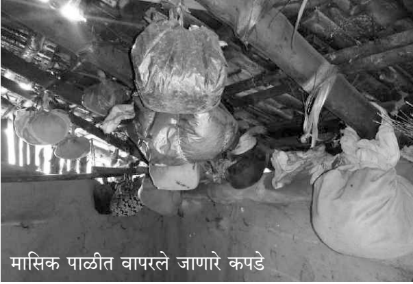
मासिक पाळीत वापरले जाणारे कपडे

भामरागड जवळच्याच एका गावातील आशा वर्करना, “इथे कुर्माघरे आहेत का?” असं विचारल्यावर त्या म्हणाल्या,