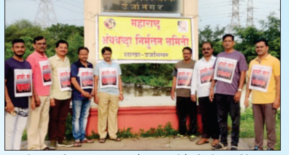
ऊर्जागर (जि. चंद्रपूर) शाखेच्या वतीने निर्भय मॉर्निंग वॉक