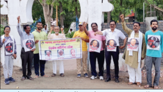
अकोला शाखेतर्फे डॉ. नरेंद्र दाभोलकर यांच्या स्मृतींना अभिवादन करण्यात आले.