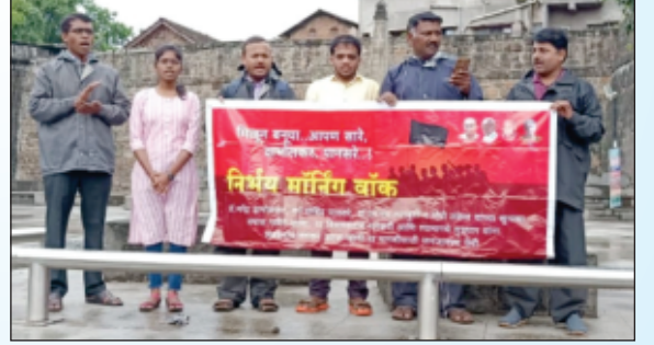
कोल्हापूर येथे निर्भय मॉर्निंग वॉक