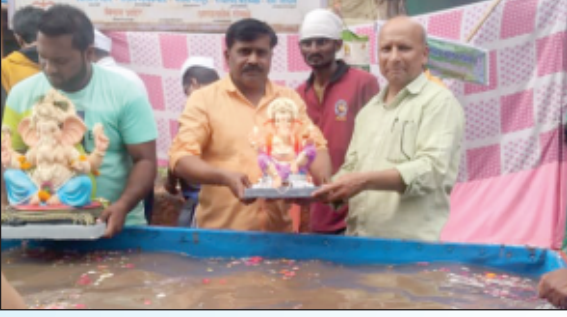
नाशिक शाखेतर्फे विसर्जित मूर्ती संकलन