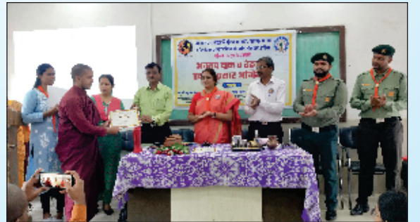
वसंतराव नाईक शासकीय महाविद्यालय नागपूर तर्फे देहदान व अवयवदान व्याख्यानमालेचे आयोजन