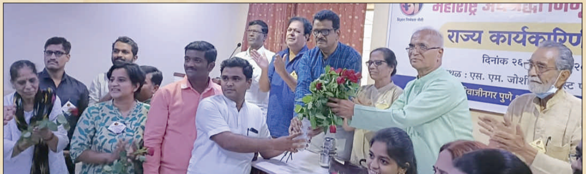
राज्य कार्यकारिणी बैठकीचे संयोजन महाराष्ट्र अंनिसच्या शिवाजीनगर पुणे, आकुर्डी, चाकण आणि जिल्हा शाखेने केले. कार्यकर्त्यांचा राज्य पदाधिकाऱ्यांच्या हस्ते सत्कार करण्यात आला.