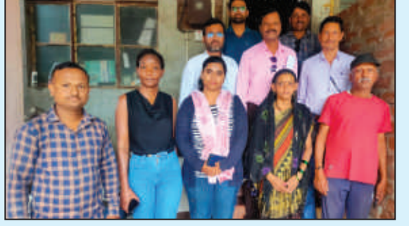
कोल्हापूर अंसिच टीमच्या वतीने महिलेचे जटानिर्मूलन