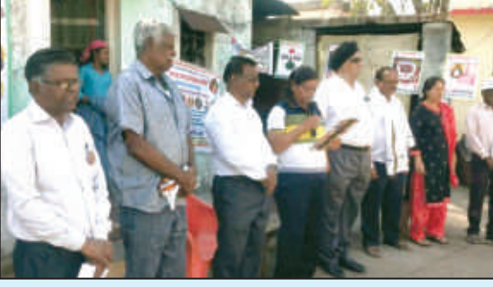
कोराडी (नागपूर) व्यसनांच्या दुष्परिणामावर प्रदर्शन