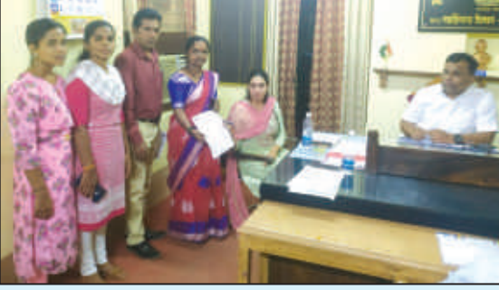
गडहिंग्लज शाखेतर्फे यात्रेत पशुबळी विरोधातील कायद्याची कडक अंमलबजावणी करणेबाबत निवेदन देण्यात आले.